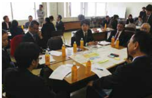
立場が異なる参加者からさまざまな意見が挙げられた

通学でのバス利用を考えるグループでは高校生のバス利用者増に向け、那覇市内の高校5校より15名の高校生が参加する「高校生によるバス利用に関する意見交換会を実施」。なぜ高校生はバスに乗らないのか、どうしたら高校生がバスを利用しやすくなるかを中心にバス事業者やPTA関係者らと意見を交換。高校生たちからは「バス乗車体験を実施」バスに荷物置き場を作って欲しい「学校でバスの乗り方・利用に関する説明会を行って欲しい」といった意見やアイデアが積極的に発表されました。 また、バス利用案内の充実について考えるグループでは、病院などの施設のスタッフが来客に対するバスの利用案内のコツを学ぶ「バスアドバイザー講習会」をオリブ山病院で実施。事後の振り返りでは「講習会の様子を動画に撮ってYouTubeでアップしたらどうか」「バスナビ沖縄のアドバイザー養成も必要など今後の展開についても検討し合いました。