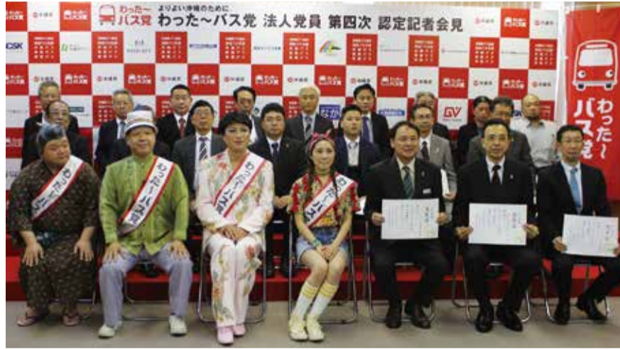
わ た ～ バ ス 党 幹 部 と 第 四 次 認 定 の 法 人 党 員 の み な さ ん