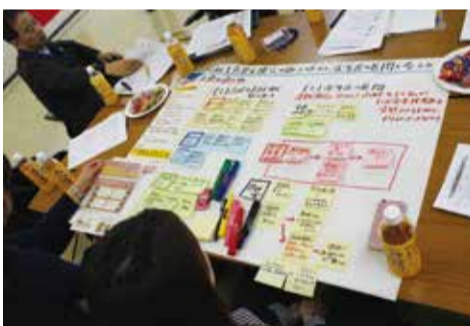
課題やアイデアは書き出してシートにまとめた

沖縄県とわたたバス党が協力し、バス事業者と沖縄県高等学校PTA連合会、那覇商工会議所青年部など利用者がバス利用者増加に向けて取り組む「バス利用促進座談会」を今年度も開催しました。昨年度の座談会で出たバス利用促進のアイデアをベースに、通勤・通学や日常での利用につながる3つの実行プランを立案。その実施に臨みました。