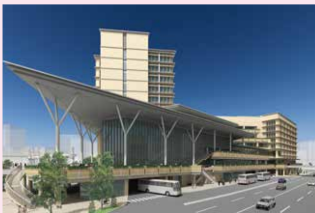
新バスターミナルイメージパース

バスユーザーはもちろん、バスビギナーも、この環境ならきっと乗ってみたいくなるはず！この秋から「新バスターミナル」で広がるスマートなバスライフを始めてみませんか。