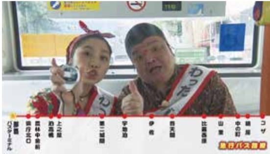
「党首と改革推進副委員長も急行バスの快適さを実感！」

那覇バスターミナルと沖縄市・コザ間を結ぶ急行バスの実証実験が2016年10月3日よりスタートし、現在も好評運行中です。急行バスを利用した際の移動時間が約14分も短縮されることから、朝夕の出退勤時・登下校時に大いに貢献しているようです。 昨年11月に実施された急行バスの利用者を対象としたアンケートからは、急行バスに対する満足度の高さや、急行バス利用者の1割が自動車からの転換者であることが分かりました。また、急行バスの利用のしやすさ、所要時間（速達性）、ダイヤ通りの運行（定時制）については、約9割の利用者が「満足」と答えており、県民の新たな足として大いに期待されています。