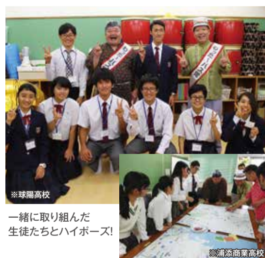
※球陽高校 ※浦添商業高校 一緒に取り組んだ生徒たちとハイポーズ!